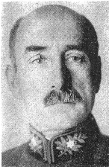
† Oberstkorpskommandant Wildbolz.

überaus umfassend. Er stellte seine Arbeitskraft einer großen Anzahl gemeinnütziger Institutionen zur Verfügung. Er verwaltete in der Kunst zu Schmieden das Vormundschafts- und Armenwesen vorbildlich. Er war Präsident der schweizerischen Kommission zum Schutze der Zivilbevölkerung gegen den Gaskrieg. Im Jahre 1920 leitete er den Austausch der Kriegsgefangenen