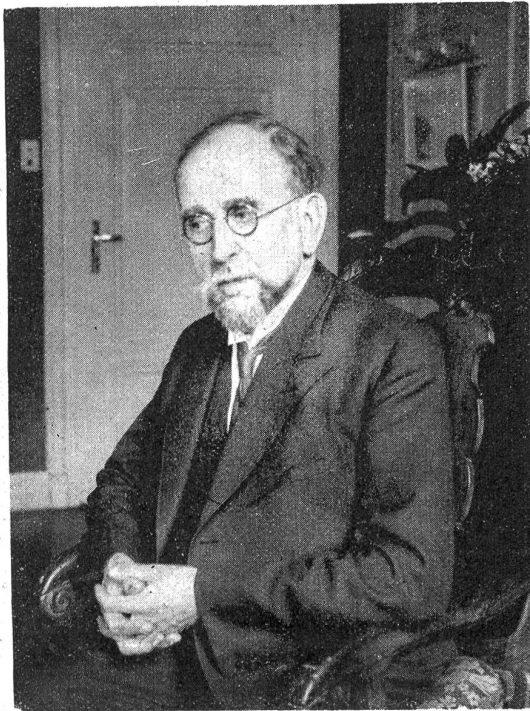
Ernst Kreidolf 70 Jahre alt. Der in Bern lebende, hervorragende Maler Ernst Kreidolf feierte am 9. Februar 1933 seinen 70. Geburtstag.

Endlich brach aus ihrer Sehnsucht, daß er sie zu sich hinüberzöge, die ungewollte Anklage: „Du gehst zur Mutter, die hat dich überredet — —“