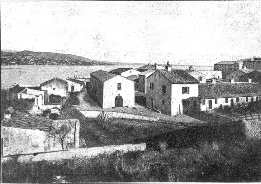
Insel St. Marguerite. Die Festung. Hier lebten die eiserne Maske und Bazaine.

Neben diesen dramatischen Werken schrieb Hebbel zahlreiche Gedichte, Erzählungen und Novellen.