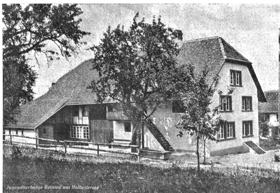
Die Jugendherberge in Beinwil am See.

Die wandernde Jugend bedurfte der Herbergen und der Heime, wo sie billige und zweckdienliche Unterkunft finden konnte. Unterkunft und Verpflegung nicht bloß für die Nacht, sondern auch für den Ruhetag und für den Regentag, durch den die Wanderung unterbrochen wurde. Das Bedürfnis schuf die Jugendherbergen und Ferienheime.