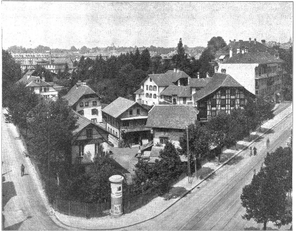
Gesamtansicht. Der hübsche Riegelbau rechts ist die Rösslimühle. Links aussen, etwas versteckt, das Kämpferhaus.

Nun sollen sie also den Forderungen der Neuzeit weichen, das Graveurstöckli, das Trödnehaus, die Rößlimühle, das rote Haus, das Calandrestöckli (einst Spezereistampfe), das Farbhaus und wie sie alle heißen. Wenn nur nicht an ihre