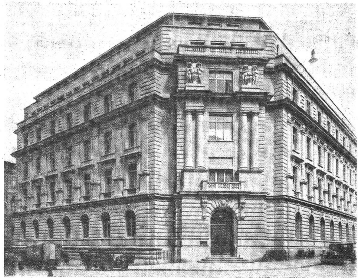
Das Telegraphengebäude in Bern nach erfolgtem Um- und Aufbau.

Im obersten, dem 5. Geschoss, das sich verjüngend über den untern Stockwerken aufbaut, befinden sich die Räumlichkeiten der Plandruckerei,