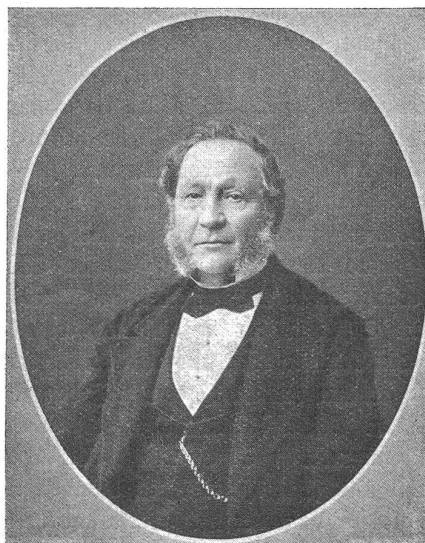
Johann Jakob Sulzer-Hirzel, der Begründer der Sulzerwerke in Winterthur.

Im Jahre 1832 kehrte er heim, machte in Winterthur zuerst eine Schraubenschneidemaschine, die damals als kleines Kunstwerk angesehen wurde. Die halbe Stadt stellte sich ein, um es zu bewundern, so daß der junge Mann sich ent-