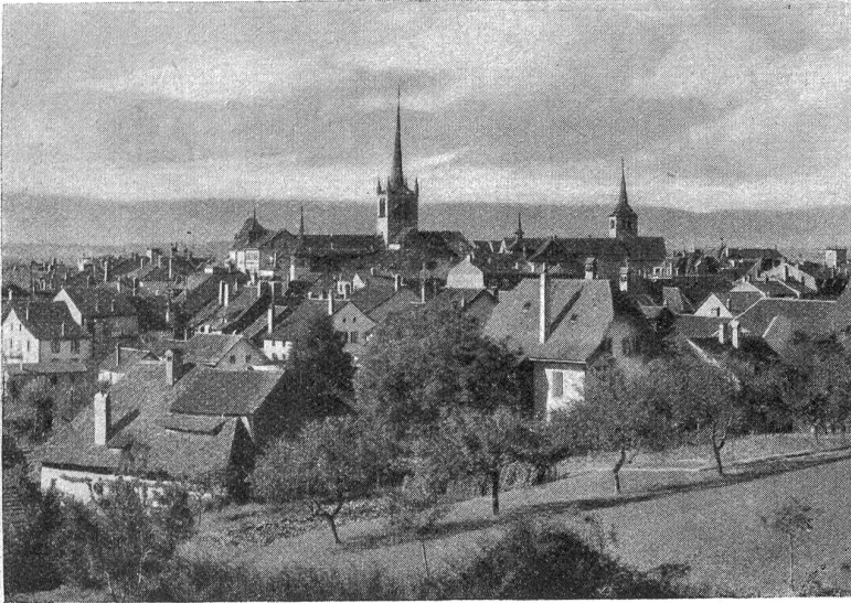
Payerne (Peterlingen). Gesamtansicht.