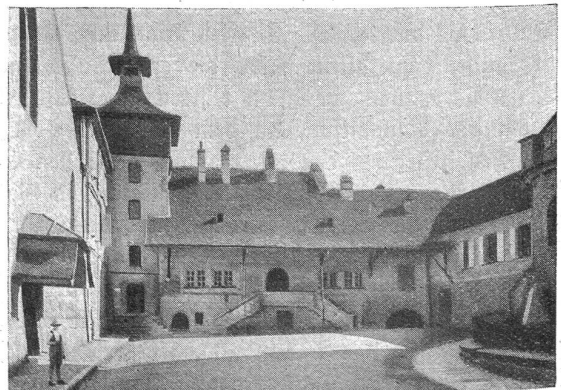
Payerne. Das Gerichtsgebäude.

Noch vieles ließe sich sagen vom sozialen, intellektuellen und religiösen Leben der Bevölkerung, von alten verwun-