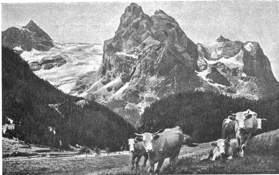
Rosenlauri. Well- und Wetterhorn.