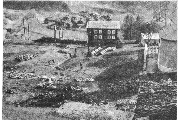
Der aufgeräumte Brandplatz.

eine gemeinnützige Tätigkeit einzusetzen. Das Merkblatt der Schweizerischen Zentralstelle für freiwilligen Arbeitsdienst sagt darüber folgendes aus: „Der freiwillige Arbeitsdienst