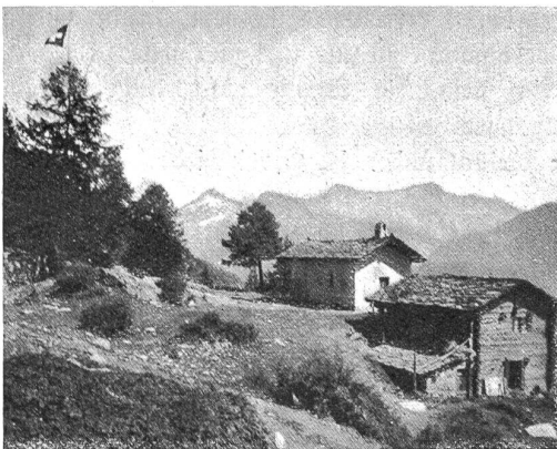
Alp Raft (Ausserberg).

Den August zog's zum Käterli hin, und das Mädchen fand den Burschen auch nicht gerade übel. Darum beschloß Tante Laura in geheimer Sitzung mit ihrem Bruder, dem Vater Argast, voranzumachen, um ja noch beizeiten dem bösen Ungefall den Rang abzulaufen. Auf diesen Entschluß hin machte die Tante allerlei mehr oder weniger geheimnisvolle Andeutungen wegen dem Verlöbniß. August hörte dieses Orakel etwas gedrückt an, Hedwig aber nahm es gleichmütig hin wie ein Ding, das ganz gut noch hätte auf sich warten lassen können, weil's aber doch einmal sein mußte, auch heute eintreten konnte, wenn's nicht wartete bis morgen. Das machte der eifrigen Tante Verdruß, sie