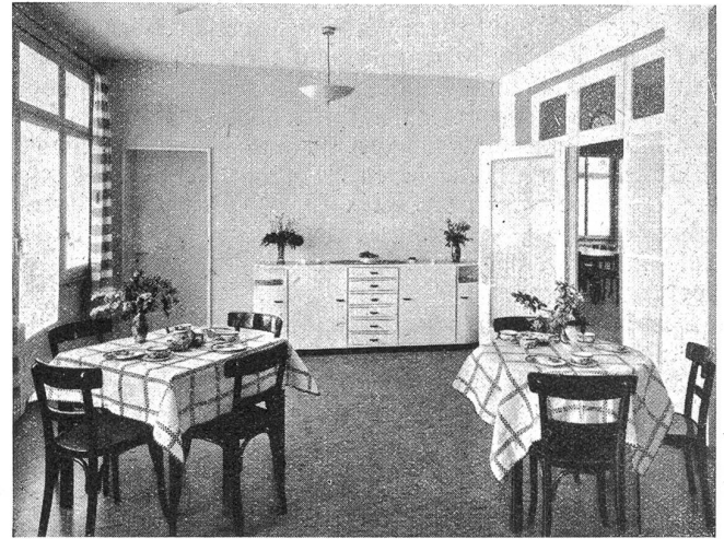
Marie Sollberger-Haus in Herzogenbuchsee: Zum Frühstück bereit.

dicken, buschigen Schweif, auf den jeder Fuchs mit Recht stolz gewesen wäre. Er hob seinen scharfgeschnittenen Kopf aus dem Ginstergebüsch empor und blieb auf seinem hügelabwärts wachsam und vorsichtig stehen, um über das