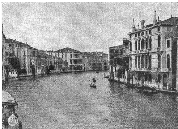
Venedig. Canal Grande.

gressist ein feines Krämlein als Andenken nach Hause gebracht. Ob wohl jeder Käufer das Erworbene an der Grenze auch verzollt hat? Der Samstagvormittag endlich war bestimmt für die Besichtigung der modernen Hafen- und Fabrikanlagen von Marghera. Ein neues, zukunftsreiches Venedig ist hier neben dem alten aus seiner glorreichen Vergangenheit entstanden und liefert einen eindeutigen Beweis dafür, daß Italien unter seinem willensstarken Duce zu neuer Zeit erwacht ist. Daß die Kongressisten in freien Stunden einzeln und gruppenweise die Markuskirche, den Dogenpalast, die Kunstakademie und weitere Sehenswürdigkeiten der kunstreichen Stadt besuchten, braucht wohl kaum erwähnt zu werden. Mancher einer hat auch nicht unterlassen, am frühen Morgen den zutrau-