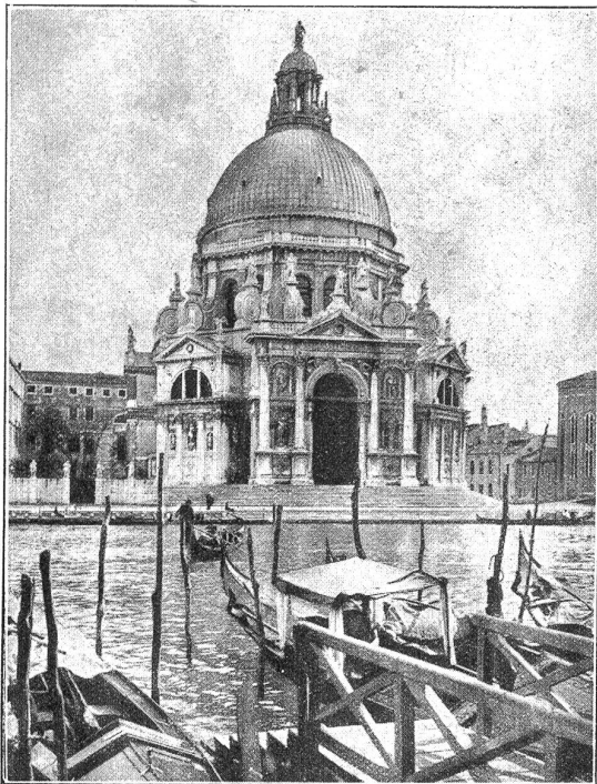
Venedig. Santa Maria della Salute.

saal arbeiteten an einer Tischdecke nicht weniger als 8 Arbeiterinnen; erst in einem Viertelsjahr soll das Kunststück fertig sein. Von Murano und Burano hat manch ein Kon-