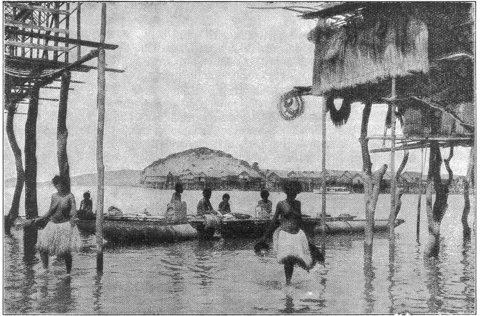
Hanuabada liegt an der Doppelbucht, die das Felsenriff von Elevara mit dem Strand bildet.