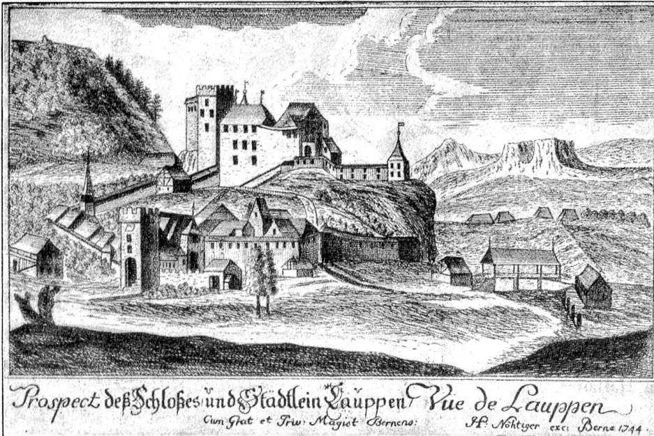
Nordseite von Laupen. Nach einem Stiche der Zentralbibliothek Zürich.

(Klischee aus dem N. Berner Taschenbuch 1925. Verlag K. J. Wyss' Erben Bern.)