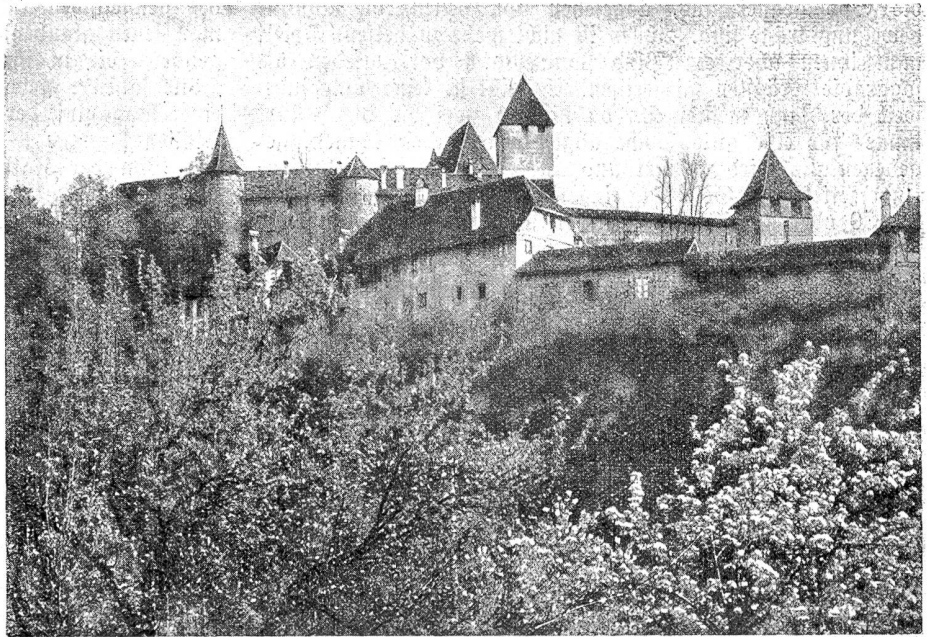
Die alte Stadtmauer mit ihren massiven Befestigungstürmen. Von Osten gesehen.

Ping-Pong ist der rechte Gefelligkeits- und Heimспорт, ist Familiensport und dadurch ein bindendes Mittel, das zugleich den Körper kräftigt. Es gehört weiter nichts dazu als ein etwa 1½ Meter breiter und 5 Meter langer Tisch. „Den haben wir nicht, also Schluß damit!“, so höre ich opponieren. Unsinn! Wer keinen so großen Tisch besitzt, be-