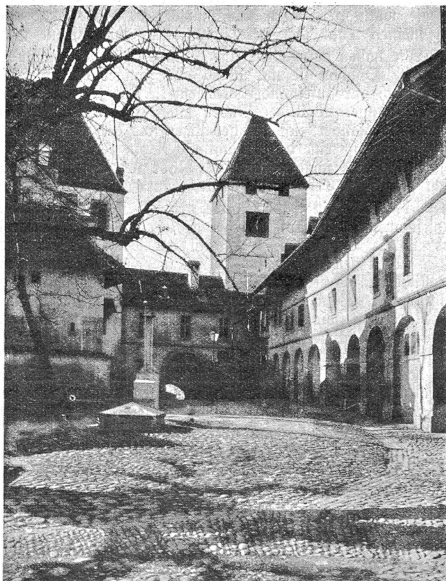
Der Burgweg mit dem breiten Hauptturm, der an seiner Front das Bernerwappen trägt.

Als stolzester Zeuge aus jener zähringisch-ayenburgischen Zeit blieb das Schloss aber bis in unsere Zeit erhalten. Ein steiler Burgweg führt von der Hauptgasse aus zum Torturm empor, der neuern Datums ist und aus dem Jahre 1559 stammt. Hingegen stammen einige der halbrunden