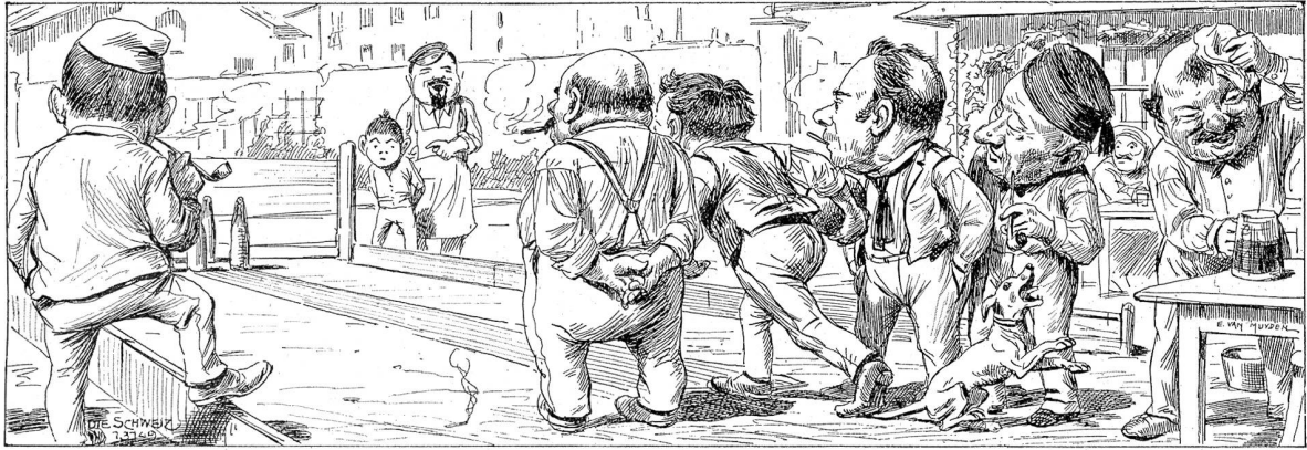
Philisterymnastik. Zeichnung von E. van Muyden.

volle Schönheit ihres Leibes und dachte an ihn, Siegfried Bogenhardt, was er wohl tun würde, wenn er sie so sähe. Sie erschrak ein wenig vor diesem Gedanken und wollte dagegen ankämpfen; es gelang ihr aber nicht. Indessen hatte sie ihr schönes Frühlingskleid wieder angezogen und ging, da es Essenszeit geworden war, in den Speisesaal hinunter. Bogenhardt saß bereits an seinem Plaze, als sie durch die Türe trat und ihn mit fröhlichen Augen leise grüßte. Dabei achtete sie scharf auf den Ausdruck seines Gesichtes und vermochte zu sehen, wie überrascht er war.