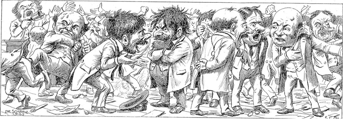
Aufgeregte Sitzung. Zeichnung von E. van Muyden.

Bei Tisch zeichnete er sie nun immer vor allen andern Damen durch besondere Aufmerksamkeit aus. Sie wollte jedoch vor ihm auf der Hut sein. Obgleich er, wie sie nun auch zugeben mußte, ein Mann war, der ein Frauenherz bald in Wallung versetzen konnte. Ihr früheres Urteil über ihn und vor allem über Frau Wehrlin wurde nun um vieles milder. Sie wußte ja nicht, wie die Schicksale der beiden zusammenhängen. Und es ging sie ja auch nichts an. Jetzt dachte sie nur noch an sich selber. Warum dieser schöne kluge Mann sich nun so sehr um sie kümmerte? Sicherlich war sie älter als er, und es waren schönere und jüngere Frauen da, um deren Gunst er sich hätte bewerben können. Es war seltsam. Was er nur von ihr wollte? Sie nahm sich vor, wie bisher freundlich gegen ihn zu sein; denn es bereitete ihrem Herzen und auch ihrer Eitelkeit ein wohliges Behagen, von einem so hervorragenden Manne mit Aufmerksamkeiten bedacht zu werden. Aber innerlich wollte sie kühl bleiben. Sie war fünfunddreißig Jahre alt und mit der Zeit zu einer guten inneren Ruhe gekommen. Was sollte ein Mann nun noch in ihrem Leben?