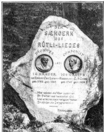
Der Gedenkstein des Dichters und des Komponisten des Rütliedes.

wieder Landarzt in Rothenburg, Hochdorf, Schongau und Altwis bei Hitzkirch, ohne es zu materiellen Gütern zu bringen, zum Teil aus eigener Schuld. Er starb im Herbst 1845