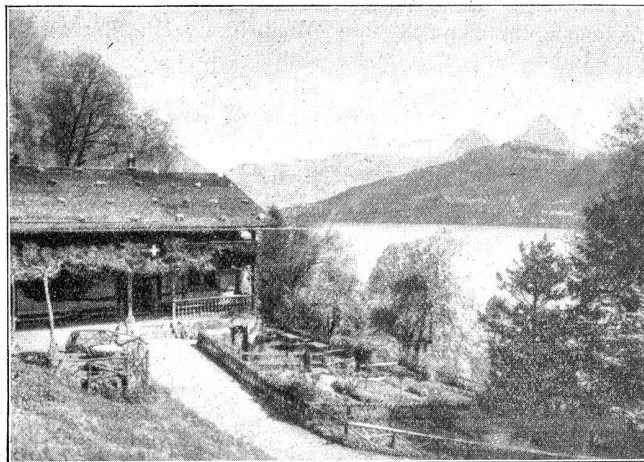
Das Rütlihaus auf dem Rütli.