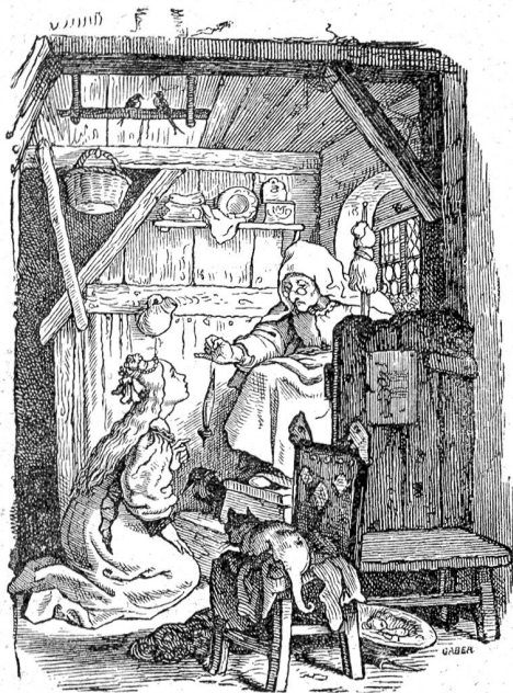
Ludwig Richter: Dornröschen.

Besinnen, „denn ich habe im Gegenteil eine vernünftige Frage von Ihnen erwartet. Und nun müssen Sie aber auch