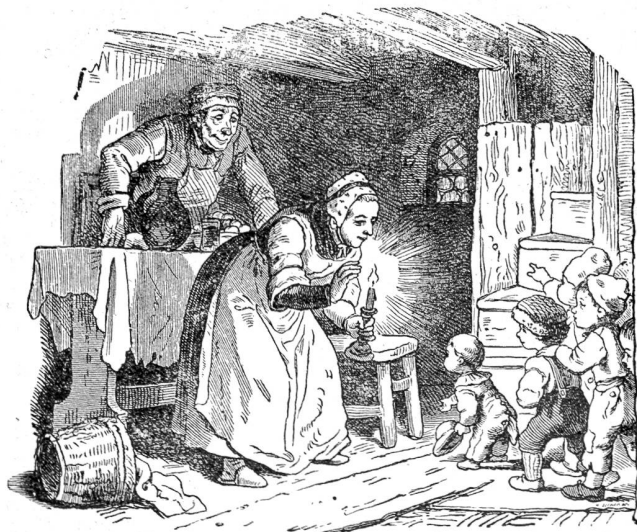
Ludwig Richter: Der kleine Däumling.

„Macht ebenfalls drei!“ Friedli Stöhr kommt gemach in Stimmung. „Ich denke, wir dürfen nicht zu viele Zusammentreffen lassen, schon weil niemand zum Nachzählen da ist.“