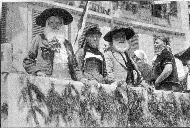
Bärnfest 1934. Guggisberger-Gruppe.