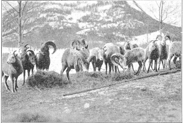
Wilde Bergschafe in den Rocky Mountains an der Wildfütterung.