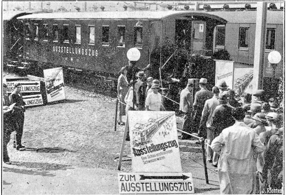
Der erste schweizerische Ausstellungszug beginnt seine Propagandareise.

Der erste schweizerische Ausstellungszug, eine fahrende Schau schweizerische Industrieprodukte, steht fahrbereit im Zürcher Hauptbahnhof und wird seine Reise nach allen grösseren Orten des Landes antreten. Es ist das erste Mal, dass sich die Bundesbahnen in Verbindung mit einer Propagandagenossenschaft in den Dienst der schweizerischen Warenpropaganda stellt. Der erste schweizerische Ausstellungszug erfreut sich (wie unser Bild zeigt) eines grossen Publikumsbesuches.