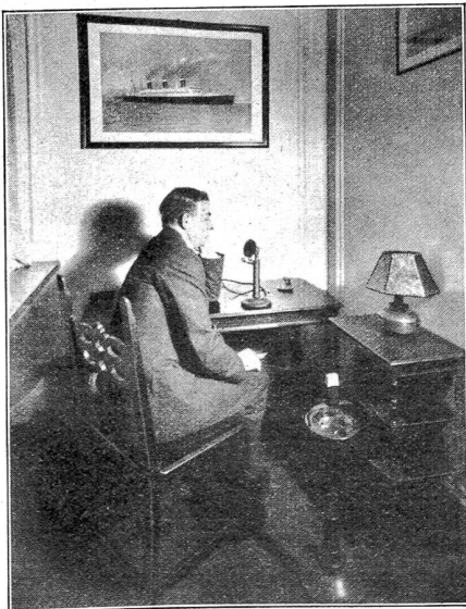
Drahtlose Telephonie von Schiff zu Land. Die Telephonkabine auf dem Dampfer „Leviathan“, von der aus die Passagiere mit ihren Angehörigen an Land sprechen können.

„Waaas? — Wie bitte?“ fragte ungläubig Mister Bigward zurück.