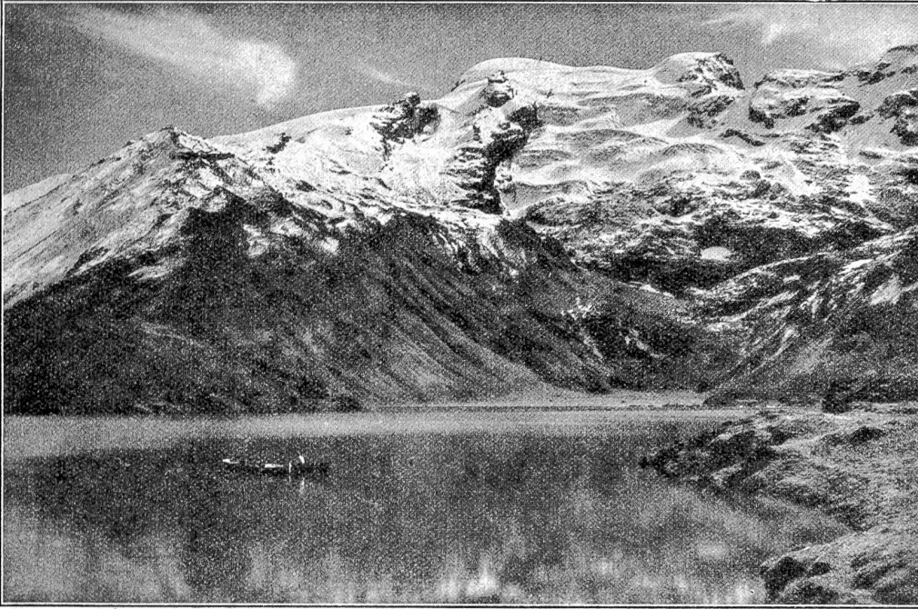
Trübsee bei Engelberg.

willen kamen; sogar der Dritte und Neunte aus Hamburg. Aber auf ihrer Totenfeier. Starr, die Hände gefaltet, ruhte sie damit in ihrem Sarg. Um ihre Lippen lag ein Lächeln.