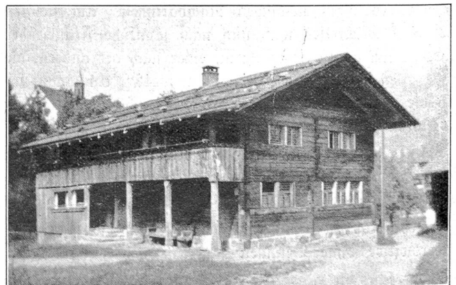
Flühli, Geburtshaus des Niklaus von der Flüe.

Da ist einmal Sarnen, das große, stattliche Dorf mit seinen Kirchen und Kapellen, Klöstern und Instituten, überragt von der schön gelegenen und sehenswerten Pfarrkirche. Auch der Landenberg, der an Stelle des zerstörten Schlosses nun die Zeughäuser des Kantons trägt, lohnt einen Aufstieg mit schöner Aussicht. Sarnen läßt sich von Kerns aus auf verschiedenen sehr reizvollen Wegen in zirka ½ Stunde erreichen; es besitzt auch ein Museum mit manch wertvollem Gut, eine prachtvoll angelegte, noch im Wachsen begriffene Strandpromenade und ein Strandbad. Den Blick über die blaue Fläche des Sees vermag der ewig griesgrämige Giswilerstod nicht zu trüben. Schilf wiegt sich leise im Wind, Seerosen schaukeln mit den Entlein um die Wette und pfeilschnell schießen die Schwalben über die Wasser-