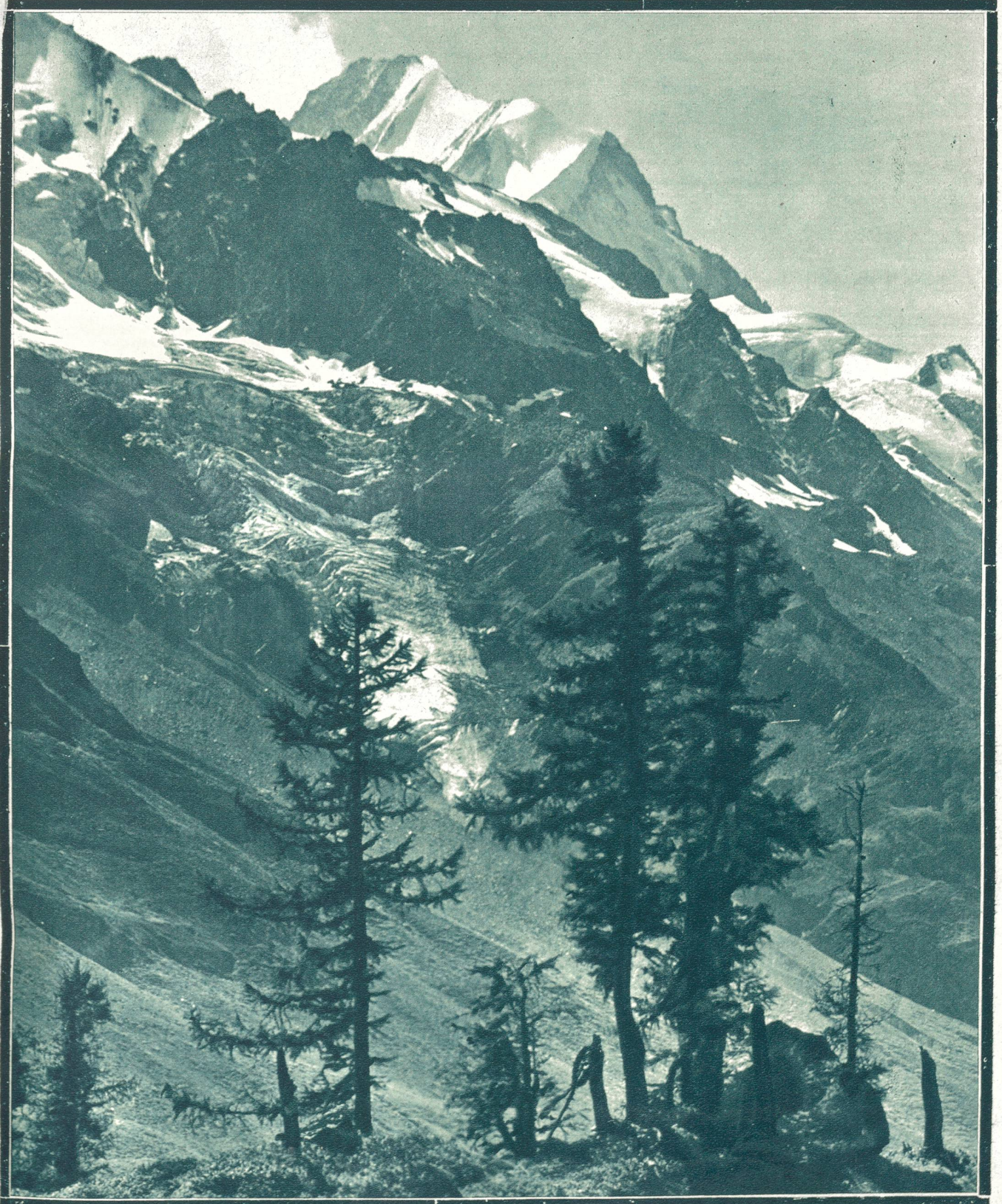
Auf Fafleralp mit Blick auf Bietschhorn im Lötschental (Oberwallis).