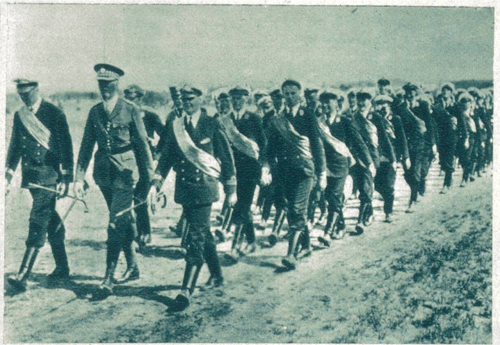
Englische See-Kadetten als Landratten. Zum ersten Mal wurden dieses Jahr Abteilungen der englischen Marine ins Truppen-Uebungslager Aldershot beordert, um im Infanterie-Dienst auch ausgebildet zu werden. Unser Bild zeigt das Ausrücken zu diesem Dienst.