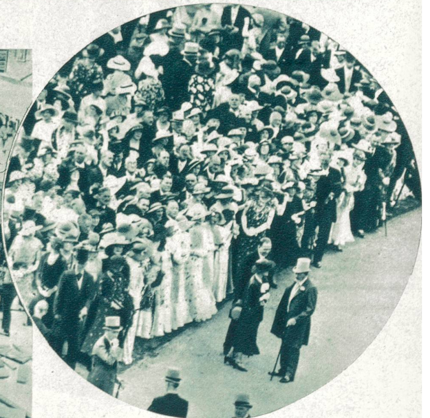
Wie ein Film gedreht wird: Produktionsszenen vom Film „Die grosse Zarin“. Links fährt Josef von Sternberg Regie in höhern Sphären.