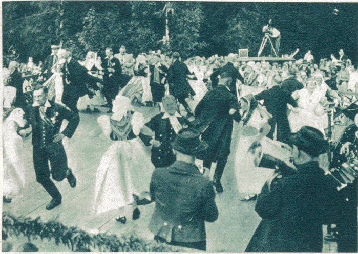
Alt-schlesische Hochzeit vom Juli 1934. In der schlesischen Stadt Schreiberhau wurde eine Hochzeit in den alten Nationalkostümen in origineller Weise gefeiert.