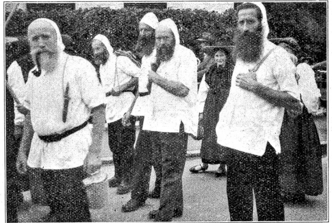
Hasliberger Heuer, Gruppe aus dem Festzug.

Die politischen Ereignisse haben fast vergessen lassen, daß diesen Sommer der deutsche Wirtschaftsminister Schmitt faktisch überflügelt wurde von Reichsbankdirektor (oder „Präsident“, um das demokratische Wort zu brauchen) Schacht, daß Schacht Wirtschaftsdiktator geworden und