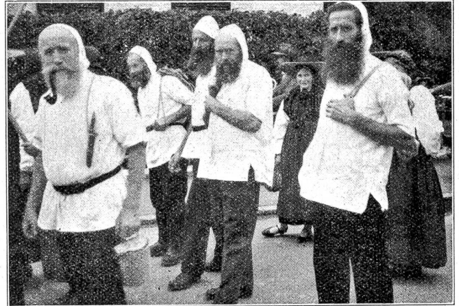
Hasliberger Heuer, Gruppe aus dem Festzug.

Die politischen Ereignisse haben fast vergessen lassen, daß diesen Sommer der deutsche Wirtschaftsminister Schmitt faktisch überflügelt wurde von Reichsbankdirektor (oder „Präsident“, um das demokratische Wort zu brauchen) Schacht, daß Schacht Wirtschaftsdiktator geworden und