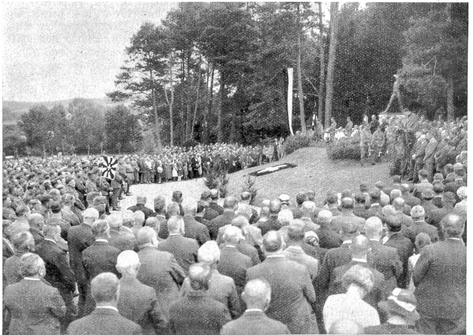
Erinnerungsfeier des Schützenbataillons 3 an die Mobilisation von 1914 beim Soldatendenkmal in Lyss. Phot. Alfr. Kuhn, Lyss.

Auf dem Genfersee wurde das erste durch Elektrizität angetriebene Schiff, die „Genève“, in Verkehr gesetzt. Dank seiner Dieselmotoren, die mit Dynamomas gekuppelt sind, erzielt es eine