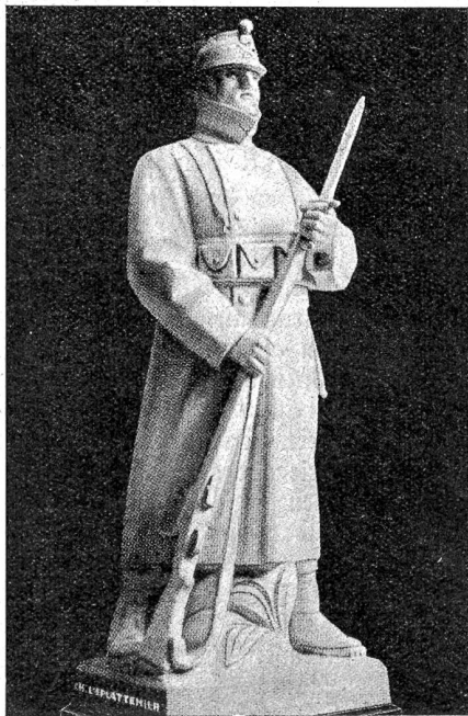
Das Soldatendenkmal auf Les Rangiers.

verzweifelt gegen die Strömung, um — immer am gleichen Fleck zu bleiben. Nur ein sekundenlanges Nachlassen, und er wäre in den sichern Tod gerissen worden. Nach langem