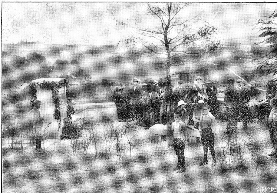
Das Bundesrat Scheurer-Denkmal.