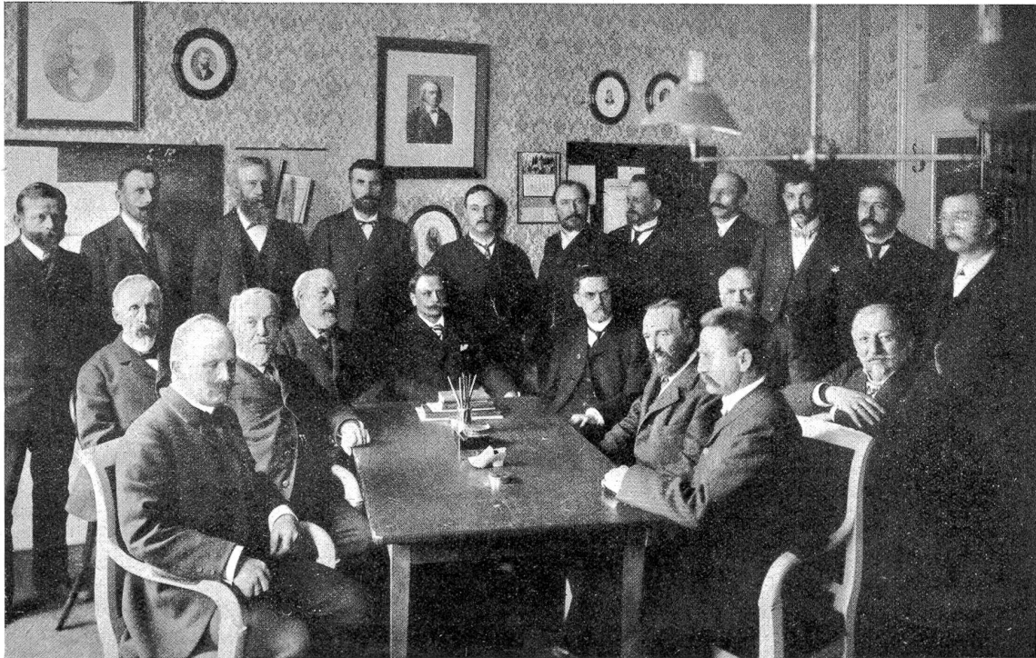
Die Lehrerschaft des Freien Gymnasiums im Jahre 1905.