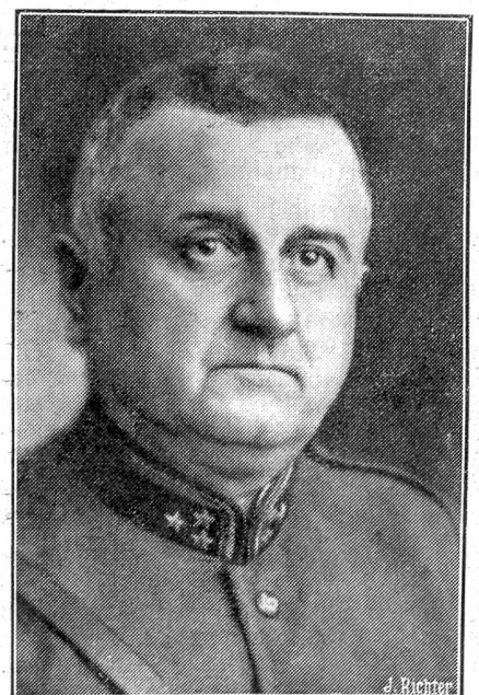
Oberst Eugen Bircher (Aarau) ist zum Oberstdivisionär ernannt worden.