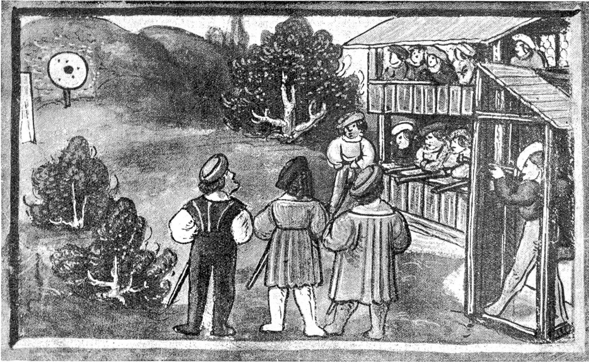
Die Zielstatt der Schützen um 1500 (aus der Chronik von Diebold Schilling.)