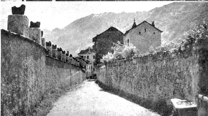
Oben: Blick auf Ascona und das Maggiateal. Mitte: Ascona und der Osthang des Monte Verità. Unten: Wegmauer in Ascona und ihre gute Wirkung.