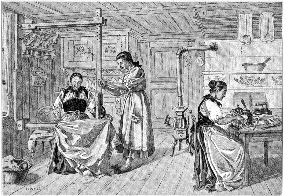
Galanderieren und Cofferieren.

„Es geschieht heute in der Menschenwelt viel mehr als jemals früher, und alles, was geschieht, bekommen wir alle zu wissen. Trotzdem wird das Leben Tag für Tag ärmer und platter. Gewiß wird lauter Hallo geschrien als jemals