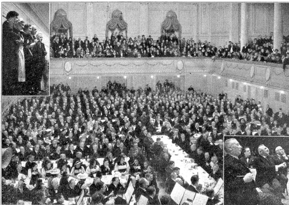
Von der Bundesrat Minger-Feier im grossen Kasinosaal, Donnerstag abend, 13. Dezember.

Die Sympathieklundgebung der Berner Bevölkerung. Der grosse Saal vermochte nicht allen Leuten Sitzgelegenheit zu bieten, so dass viele in den Türflücken, auf den Garderobebänken und Tischen sich postierten. Unten rechts: Die Bundesräte Baumann, Minger und Motta folgen aufmerksam den Darbietungen der Veranstalter.