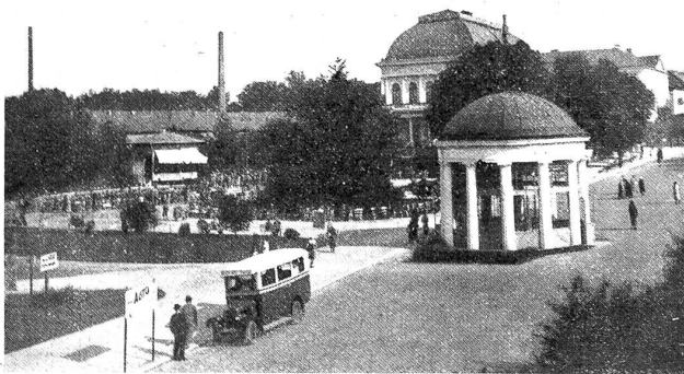
Franzensbad mit Franzensquelle.

Merkwürdig: Ein Leberkranker ist einfach leberkrank, ein Zuckerkranker zuckerkrank. Aber daneben ist er normal.