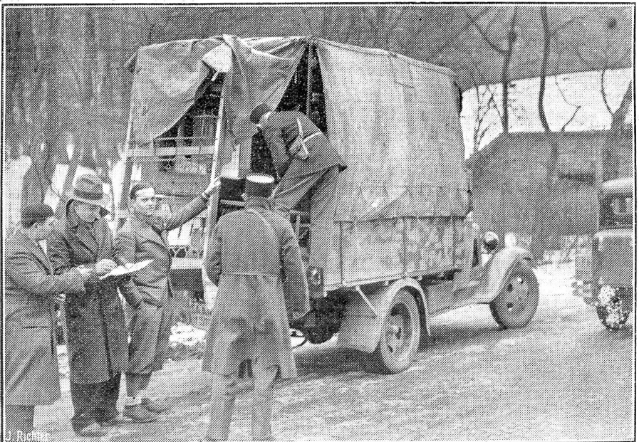
Aus dem Saargebiet. Emigranten-Möbelwagen werden an der „Goldenen Bremm“ in der Nähe von Forbach von französischen Zoll- und Grenzbeamten kontrolliert.

Jedoch: Feststellen und verstehen heißt nicht billigen,