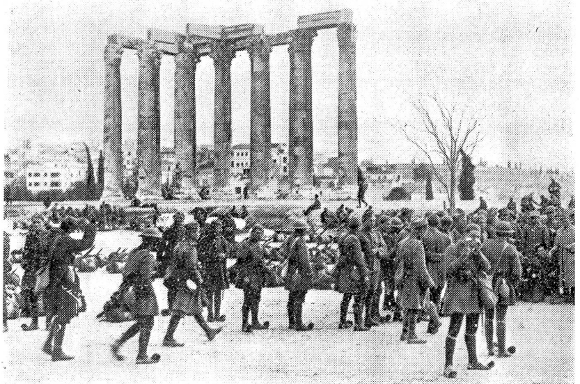
Zu den Vorgängen in Griechenland. Unser Bild zeigt den Platz vor dem Tempel des olympischen Zeus, der in ein Kriegslager verwandelt ist.

Immer noch wird gerätselt über die fremden Mächte, die hinter Venizelos stehen könnten. Es fällt den Franzosen auf, daß er sich offensichtlich gut mit Rom versteht. Aber Rom hat sich in Abessinien engagiert. Leute, die gezählt haben, wissen zu berichten, die bisher nach Ostafrika speidierten Truppen umfahnen mehr als hunderttausend Mann. Daß der kriegslustige Fascismus gleichsam nebenbei dem neuen Verbündeten Frankreich Feuer in sein wohlkonstruiertes Balkanbundgebäude legen würde, scheint beinahe unglaubwürdig. Und träfen die Vermutungen