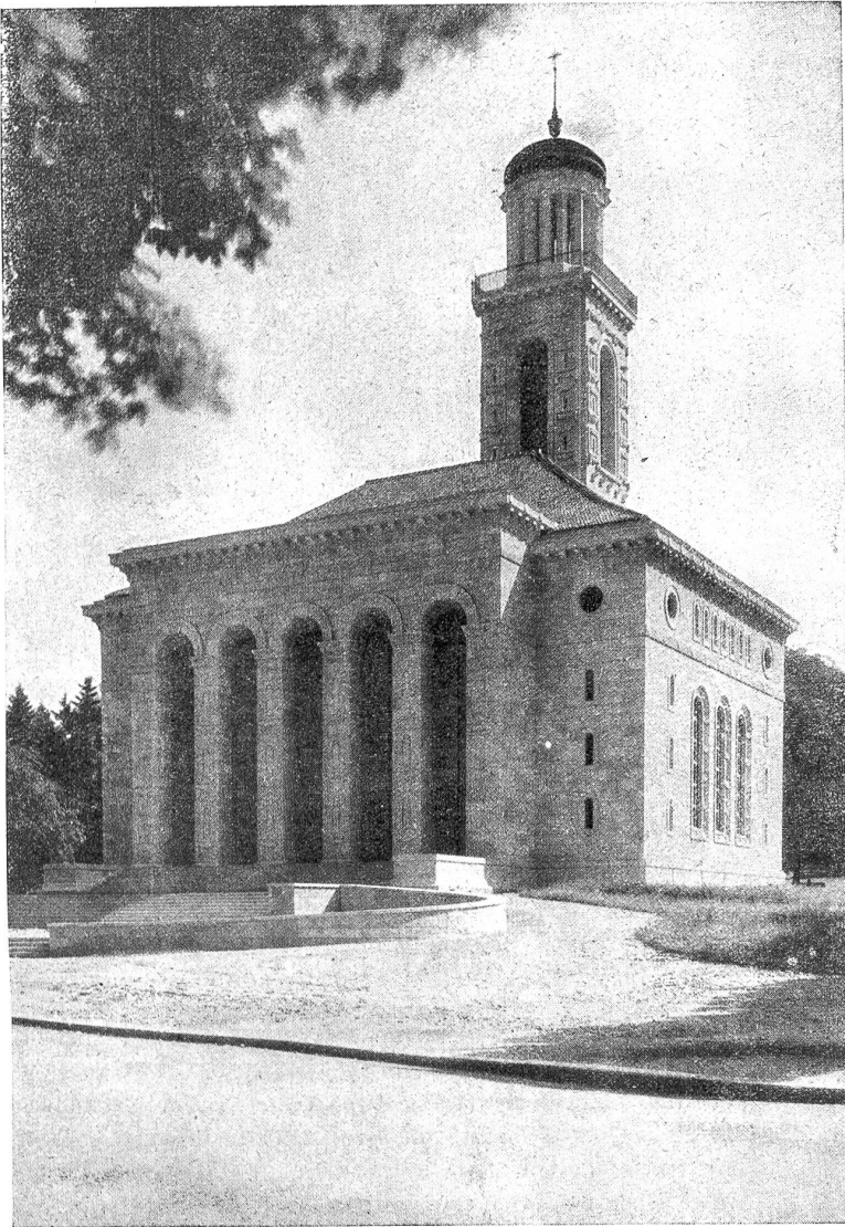
Neue reformierte Kirche, erbaut 1922—1925.

und verschwand wutschnaubend in seinem Käfig. Das Blut stieg ihm verheerend ins Hirn, als er auf den Verdacht kam, die Jungfer vom Musterzimmer könnte das elende Gewäsch aufgebracht haben. Wer anders denn? Ein Zweifel war einfach ausgeschlossen.