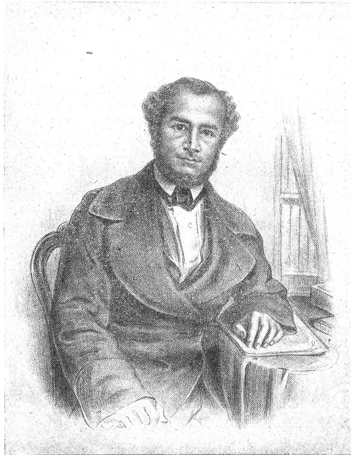
Pfarrer Ludwig Lindt (1809—1857).

Mehrheit volles Verständnis und freundliche Förderung. Ja, der Große Rat gab bei Erlaß des „Gesetzes über Einführung eines öffentlichen, evangelisch-reformierten Gottesdienstes in Solothurn“ unterm 1. April 1835 auch die Zusicherung einer jährlichen Subvention von Fr. 300 auf 10 Jahre. Auch bei der Beschaffung eines Gottesdienstlokales — es wurde die uralte St. Stephanskapelle, die heute nicht mehr besteht, eingeräumt — hatte die kleine Gemeinde auf das Wohlwollen der Behörden zu rechnen. Von großer Wichtigkeit wurde die Wahl des ersten Pfarrers: Ludwig Lindt, bisher Lehrer in Biel, wird von der Regierung gewählt, eine taktvolle und zuverlässige Persönlichkeit, die in allen Kreisen der Stadt Anerkennung erntete.