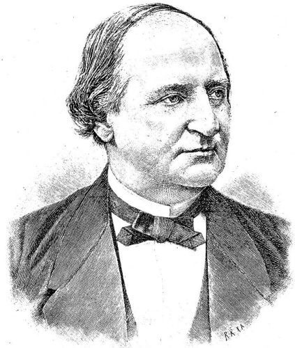
Sängervater Franz Abt.

schule Musik pflegen. Schon als Student komponierte er und fand Anerkennung und Anklang mit seinen Schöpfungen. Er leitete den Studentengesangsverein. Da starb der Vater und Abt mußte das Theologiestudium aufgeben, um sich mit Hilfe der Musik selber durchzubringen. Er wurde 1841,