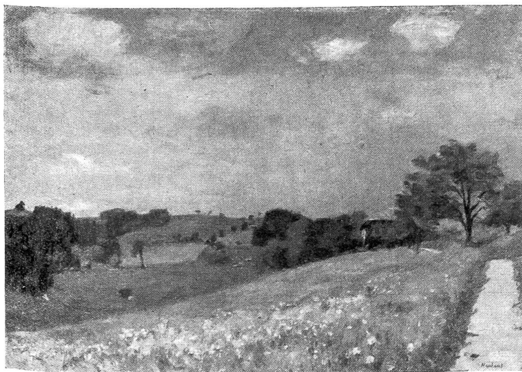
Werner Neuhaus: Frühling 1934.

Sie sah sich dahinwelken und fühlte, daß sie die beste Zeit ihres Lebens nutzlos verändelt und vergeudet hatte. Im letzten Dezember war es gewesen, als der junge, sanfte Gelehrte mit den träumerischen Augen sich ihr genähert hatte. Aber da sie auch diesen wie bereits so viele andere leichtfertig und scherzhaft genommen hatte, war es zu keinem Entschluß gekommen, denn der Mann hatte seine Liebe ernst genommen und sich gekränkt abgewandt. Heute, nach Monaten, nachdem der einsame, stille Winter voller Einker und ernststen Nachsinnens vorüber war, fühlte Yolanda, daß sie das Glück ihres Lebens verscherzt hatte. Jenen stillen, gereiften Mann mit der hohen Stirn und den treuen Augen hatte sie geliebt, sonst noch keinen vor ihm. Aber nun war es zu spät. Er war längst fortgezogen und sie wußte nichts mehr von ihm, als daß er irgendwo im Ausland zum ordentlichen Professor ernannt worden war und ausschließlich seiner Wissenschaft lebte. Auch er hatte eine Hoffnung begraben müssen, eine Hoffnung, deren Erfüllung in Yolandas schlanken weißen Händen gelegen wäre, hätte sie nicht achtlos mit einem Manne gespielt, der in ihr die Auserwählte seines Herzens gefunden hatte.