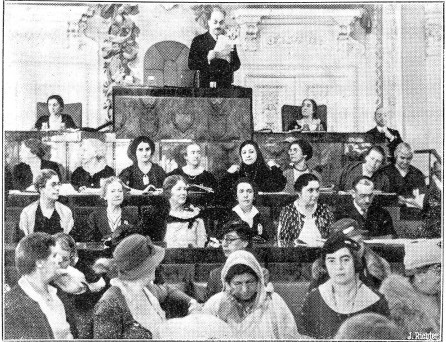
Internationale Frauentagung in Istanbul.

Jetzt wandte sich der Doktor scheinbar zornig zu ihm. „Was sollen diese Boffen bedeuten! Wollen Sie uns zum Narren halten, weil wir Fremde sind, hergekommen, um etwas zu lernen. Donnerwetter! Scheren Sie sich fort mit Ihren alten Skeletten. Wenn Sie einen schönen frischen Leichnam haben — her damit, sonst aber, bei Sankt Georg, schlagen wir Ihnen den Schädel ein!“