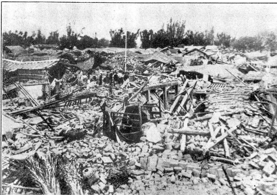
Formosa nach der Erdbebenkatastrophe.

Kürzlich wurde die japanische Insel Formosa von einem Erdbeben heimgesucht. Über 3000 Tote und 11,000 Verletzte wurden gezählt. 15,000 Häuser wurden völlig vernichtet und fast 23,000 stark beschädigt. Der bisher feststellbare Schaden beläuft sich auf ca. 21 Millionen Yen. Unser Bild zeigt ein völlig zerstörtes Wohnviertel in Tobou auf Formosa.