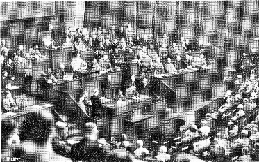
Die grosse Rede des Führers im Reichstag.

Die von der ganzen Welt mit grosser Spannung erwartete Rede des Führers und Reichskanzlers Adolf Hitler in der Reichstagssitzung hat in der Krolloper stattgefunden. Unser Bild zeigt den Führer bei seiner Rede.