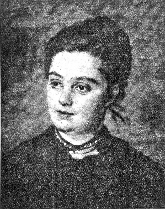
Rudolf Koller: Bildnis einer jungen Frau.

aus einem vertraulichen Lächeln heraus. „Tu jetzt doch nicht so dumm, du! Und sitz wieder ab!“