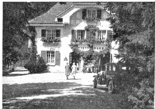
Gebäude der Talstation in Mülönen.

In 33 Minuten fährt die Bahn von Mülönen (693