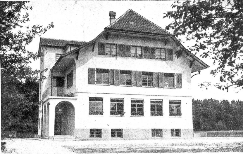
Das neue Schulhaus in Wiler bei Utzenstorf. Stirafront und Nordseite.

Sehr wahrscheinlich kam es ihnen gar nicht so unerwartet, als im letzten Jahre die Erziehungsdirektion ihr altes, über hundertjähriges Schulhaus etwas eingehender betrachtete und ziemlich eindringlich einige Aenderungen wünschte. Und wirklich, wenn dieses alte Gebäude mit den kleinen Fenstern und dem verwetterten Gesicht als Wohnhaus auch noch gehen mag, für eine zweiteilige Schule mit einer großen Schülerzahl war es doch zu „schütter“. Man sagt, die Buben hätten sich den Spaß gemacht, in der Schulstube zu hornussen und hätten den Hornuß vorn im Zimmer mit Tafeln abgetan, den die andere Partei hinten von einem Dredklümplein losgeschlagen hatte. Und mit den Fensterscheiben hätten sie sich auch allerhand Späße erlaubt. Item, übel genommen hat das alte, einem runzeligen Mütterchen gleichende Haus nicht mehr viel, war es doch mehr als hundert Jahre alt und hatte seine Pflicht redlich getan. Und auch damals, anno 1833, als es auf die Grundmauern des abgebrochenen und versteigerten, ersten Schulhauses gebaut wurde, hat man solchen Bauten noch nicht die Bedeutung von heute beigemessen. Sie wurden erstellt, schlecht und recht, wie man es verstand und in den Gemeindeversammlungen wird es geheißen haben: „Es wärds dänk wohl tue, es bruuchi da kei Lufus“.