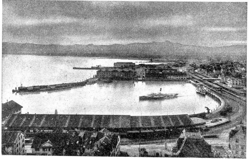
Hafenansicht mit Lagerhäuser der S. B. B.

Es ist klar, daß bei einer solchen Verkehrsentwicklung — Romanshorn ist neben St. Gallen der bedeutendste Verkehrsort in der Ostschweiz — auch die Ortschaft selber erstaunlich aufblühte. Vor einem Vierteljahrhundert wurden zwei neue, große Kirchen mit einem Kostenaufwand von je einer halben Million Franken erbaut. Ein Gaswerk, das heute der Gemeinde gehört, entstand im Werte von 600,000 Franken. Stattliche Schulhäuser, zwei Badanstalten und ausgedehnte Wohnquartiere wurden gebaut. Die Baugenossenschaft des Verkehrspersonals besitzt allein 47 Häuser mit 98 Wohnungen. Die Anlage des ganzen Ortes ist frei, die Bauart offen und der Geist der Bevölkerung, die 6500 Seelen zählt, fortschrittlich. Die Industrie ist nicht sehr bedeutend, was eine starke Verproletarisierung wie in Arbon verhindert hat. Seit dem Weltkrieg und den Krisen Jahren ist allerdings ein Stillstand in der Verkehrsentwicklung