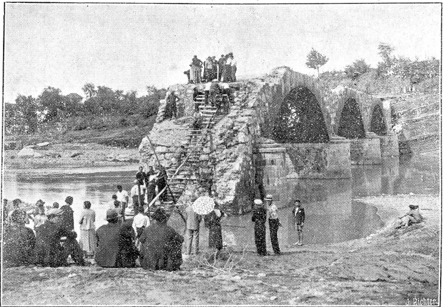
Der Dambruch bei Ovada (Italien). Unser Bild zeigt eine der vier eingestürzten Brücken.

Ein wunderbare isch mer gsi wie dr Pilot i mene fettige Näbel si Wäg gfunde het. U d'Frag het mi bsunders beschäftigt wägem Lande. Mi cha ja ganz sicher mit eme Kompaß stüre. I ha mer la erzelle, wi me uf drahtlosem Wäg chönn em Pilot Zeiche gä, daß dä geng ganz genau wüß, wo ner sig, was er mache müeß. Er sig geng mit ere Bodestation i Verbindig und drum chönn er so sicher da obe i de Lüfte si Wäg suche. Mir hei üse Wäg a Bode abe nid müeße im Näbel sueche. Es het wieder ufta, wo mer gäge d'Schwiz cho si. I weiß nid wie mers gange isch. I ha so viel gseh, daß i ganz erstunt gfragt ha, was isch das für e große Strom da unde? Mi het mer gantwortet: Se, dr Rhj. Tä und de die große Stadt mit dene Brügge u Chilchsturm, isch das scho Basel? Wahrhaftig, es isch halbi sächsi gsi u mir sie wieder i nere elegante Schleife uf e Bode cho. Kei Minute zfrüh u keini zspät. I bi ganz überrascht gsi über die Pünktlichkeit.