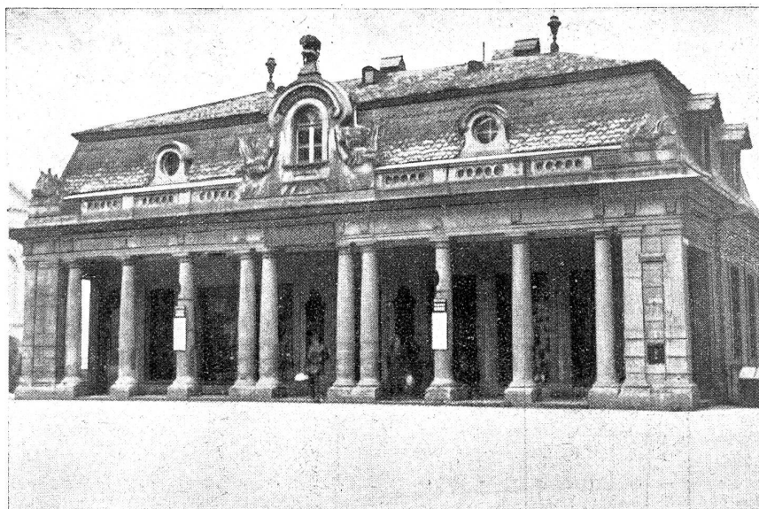
Die „Alte Hauptwache“ in Bern und die Kasinoplatzfrage. Dieses einzig schöne Bauwerk aus der glorreichsten Epoche der bernischen Baugeschichte soll unserer Stadt erhalten bleiben. Eine gute Lösung steht in Sicht. Die kantonale Baudirektion hat vier massgebende Architekturfirmer der Stadt mit der Ausarbeitung von Vorschlägen beauftragt. Ihre Aufgabe ist, die bestmögliche Verkehrsführung herauszufinden bei Balassung der Hauptwache an heutiger Stelle.

Uebrigens taucht dieser „Toilettenstreit“ schon seit ich denken kann immer zugleich mit der Hundstagsfestschlange auf, die z'Bären demalen allerdings durch die „Kasinoplatzfrage“ ersetzt wurde. Die will nämlich auch nicht zur Ruhe kommen und da die Aestheten das Hauptgewicht auf einen baulich schönen, die Verkehrsanbieter aber auf einen geräumigen Kasinoplatz legen, so wird die Frage wohl überhaupt nicht so bald entschieden werden. Der Kasinoplatz aber wird auf irgendeine Art und Weise umgebaut werden, mit der dann überhaupt niemand mehr zufrieden ist. Wir z'Bären sind ja doch meist nur für Mittellösungen zu haben, das heißt, beide Parteien parlamentieren so lange um den heißen Brei herum, bis keine mehr weiß, was sie ursprünglich eigentlich wollte und dann einigen sie sich auf eine Lösung, an