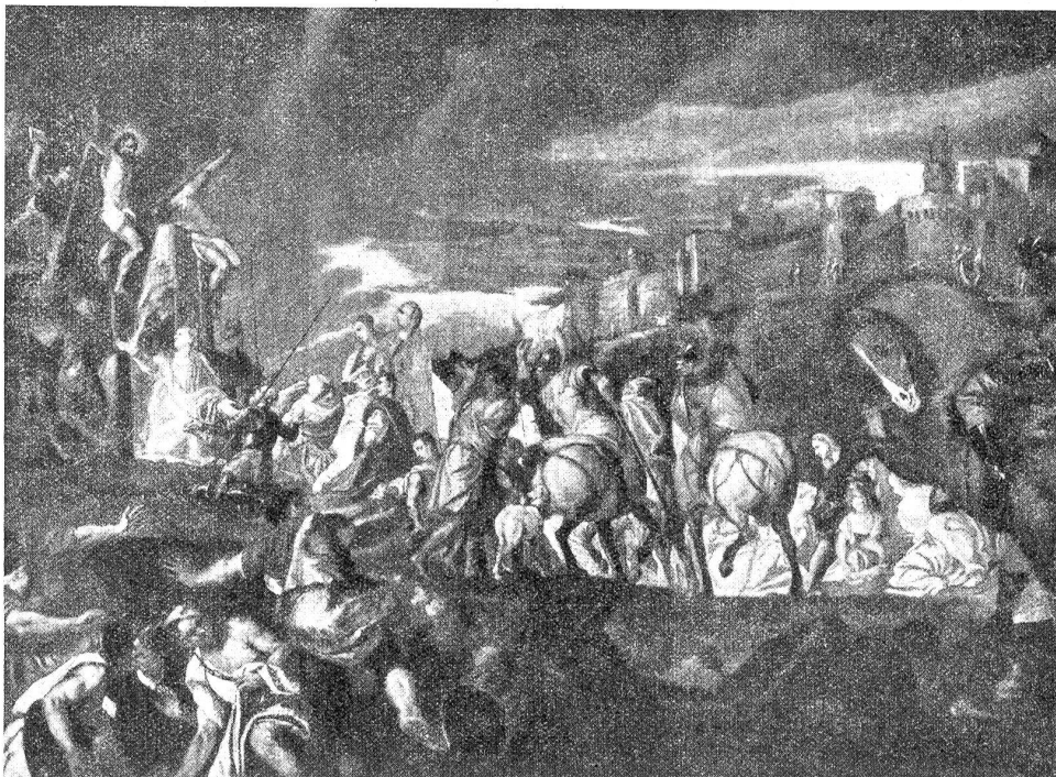
Kreuzigungsszene. Paolo Veronese zugeschrieben.